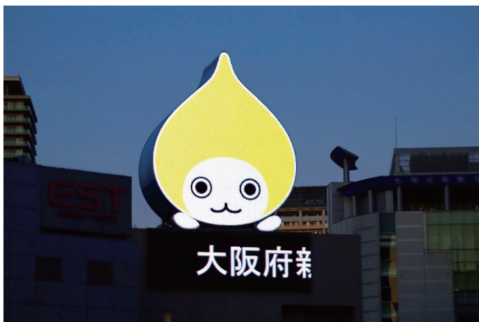
写真:大阪・梅田の「大ぴちゃんくん」看板