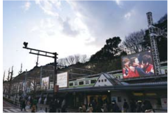
【作品名】 東京オリンピック招致 【広告主】 特定非営利活動法人 東京2020オリンピック・パラリンピック招致委員会 【デザイナー】 株式会社電通・株式会社電通テック 【制作者】 株式会社NKB