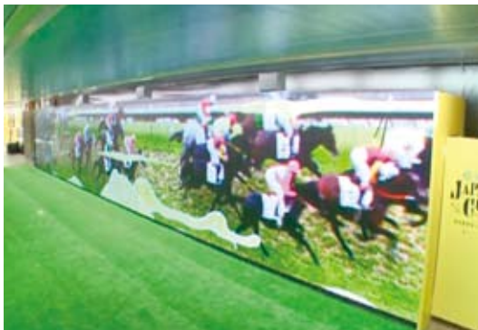
【作品名】 日本中央競馬会の広告 【広告主】 日本中央競馬会 【デザイナー】 株式会社ピクス 【制作者】 株式会社東急エージェンシー