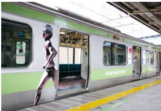
【作品名】 アシックスブランド広告 2020・東京オリンピック招致 【広告主】 アシックス ジャパン株式会社 【デザイナー】 アシックス ジャパン株式会社 【制作者】 株式会社ジェイアール東日本企画