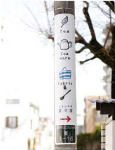
【作品名】 葉々屋 【広告主】 紅茶舗 葉々屋 【デザイナー】 株式会社東広・紅茶舗 葉々屋 【制作者】 東宣工藝株式会社