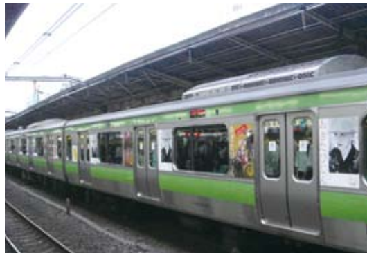
【作品名】 秋田県イメージアップ車体広告 【広告主】 秋田県 観光文化スポーツ部 観光振興課 【デザイナー】 梅原デザイン事務所 【制作者】 株式会社ジェイアール東日本企画 秋田支店

企画からデザイン・撮影・施工まで、あらゆる ビジュアルニーズに応える総合コマーシャルラボ。