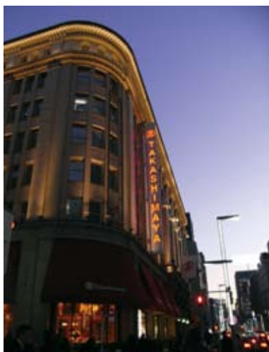
【作品名】 マーク・TAKASHIMAYA 【広告主】 株式会社高島屋 日本橋店 【制作者】 株式会社昭和ネオン